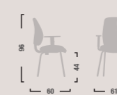
QD26 Sedia fissa con braccioli. Fixed armchair.