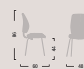
QD27 Sedia fissa senza braccioli. Fixed chair.