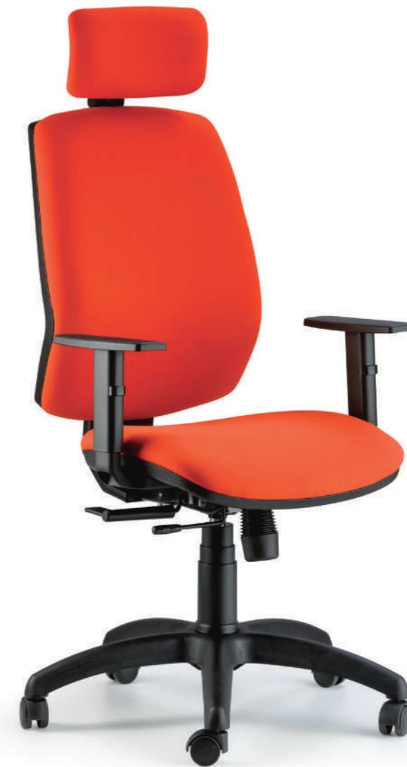
QUID OPERATIVE CHAIR