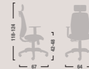
QD20 Poltrona ergonomica alta braccioli regolabili e oscillante mov.4. High ergonomic armchair adjustable with mov.4.