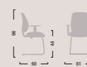
QD24 Sedia fissa con braccioli. Fixed armchair.